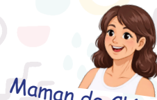
Maman de Clémentine